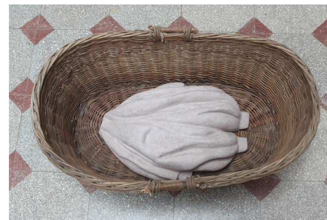
• Gyuk Krisztina: Mózeskosár mészkö, fonott kosár 25x74x20 cm 2019