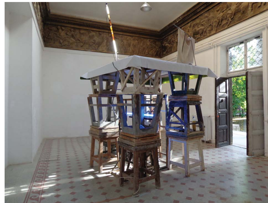
• Komoróczy Tamás: A stílus maga a pillér helyspecifikus installáció 2019