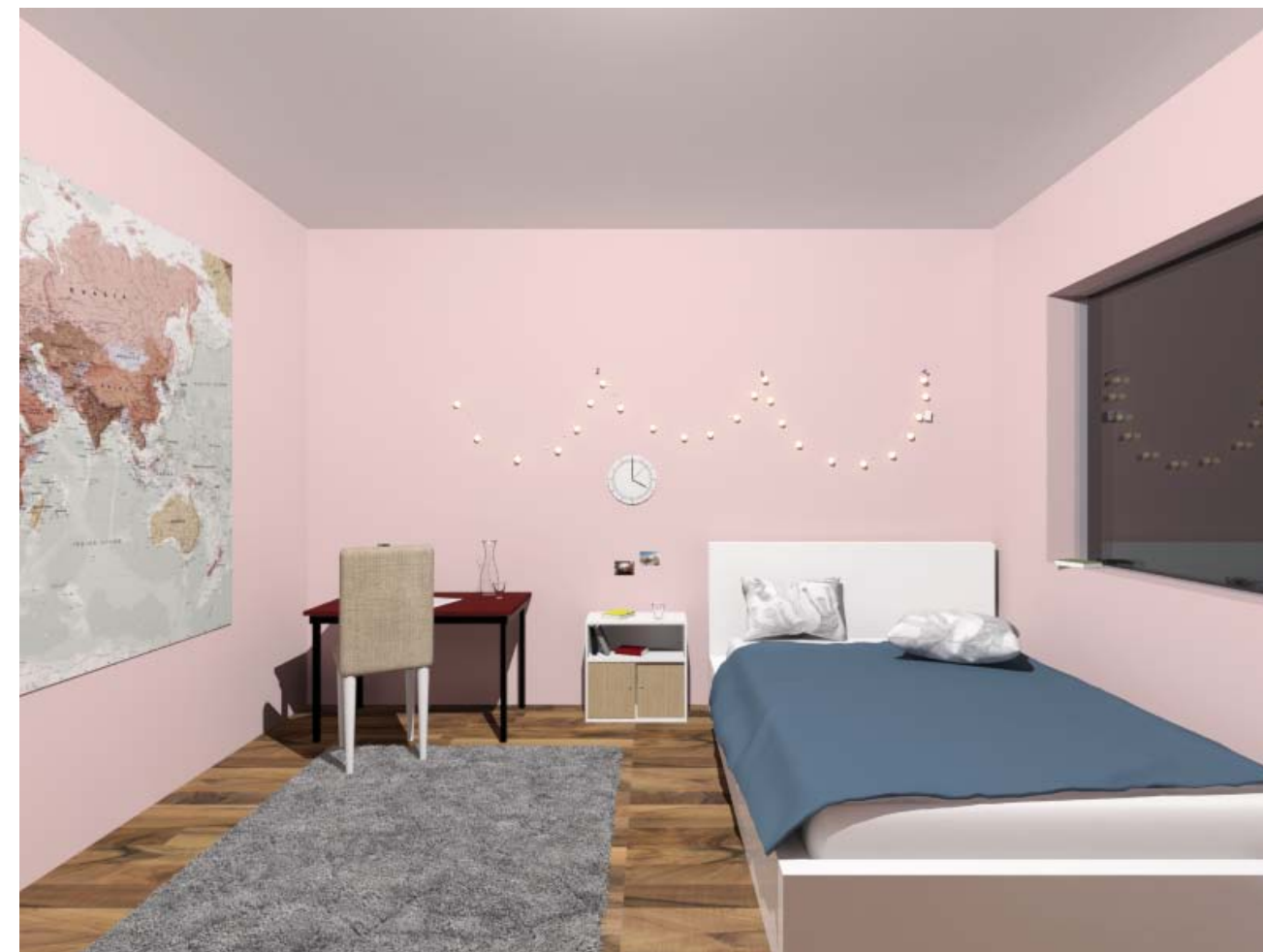
• Für Johanna: Enteriőr 2019