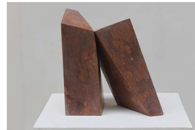
• Harsány Patrícia: Támasz mészkö 25x8x8 cm 2019