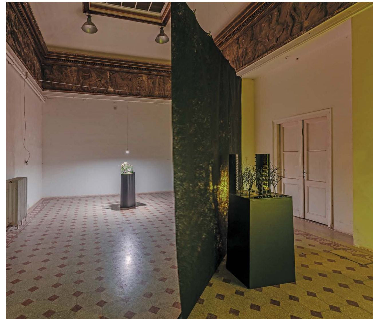
• Kiállítás enteriőr