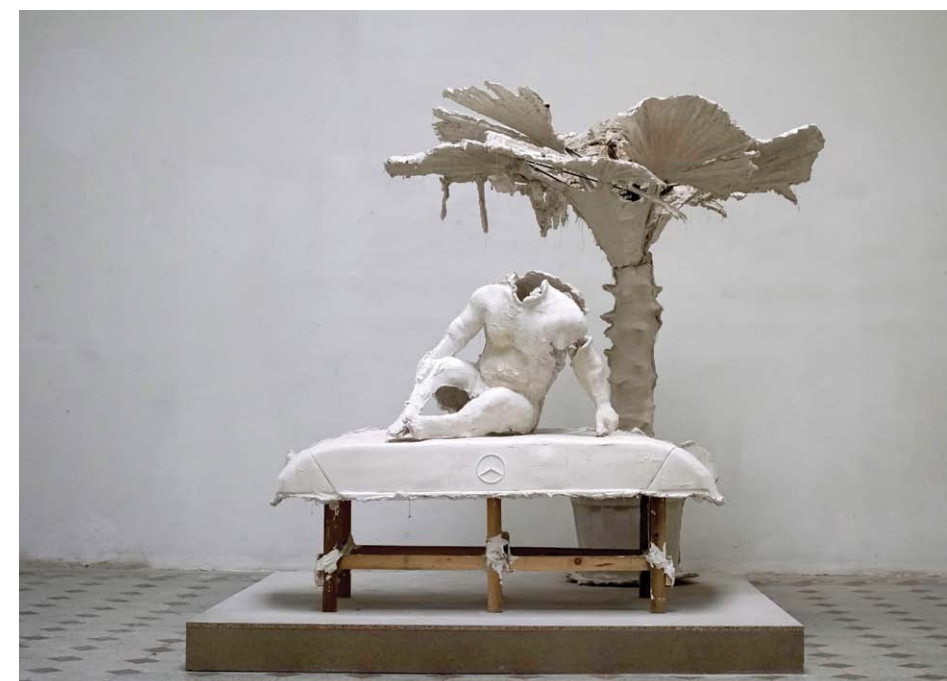
• Ámmer Gergő: Crepuscolo gipsz, vas, fa 230x195x195 cm 2020