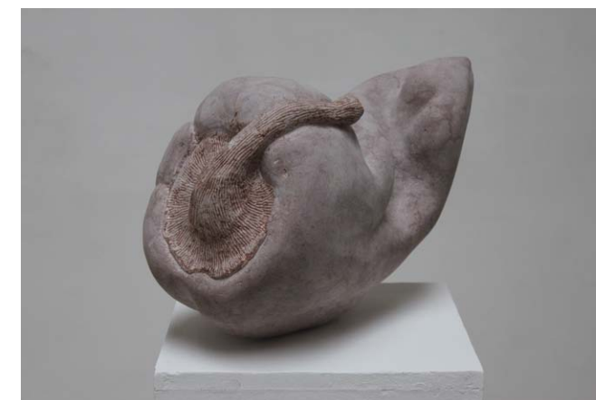
• Varga Richárd: Paprika mészkö 28x45x20 cm 2019