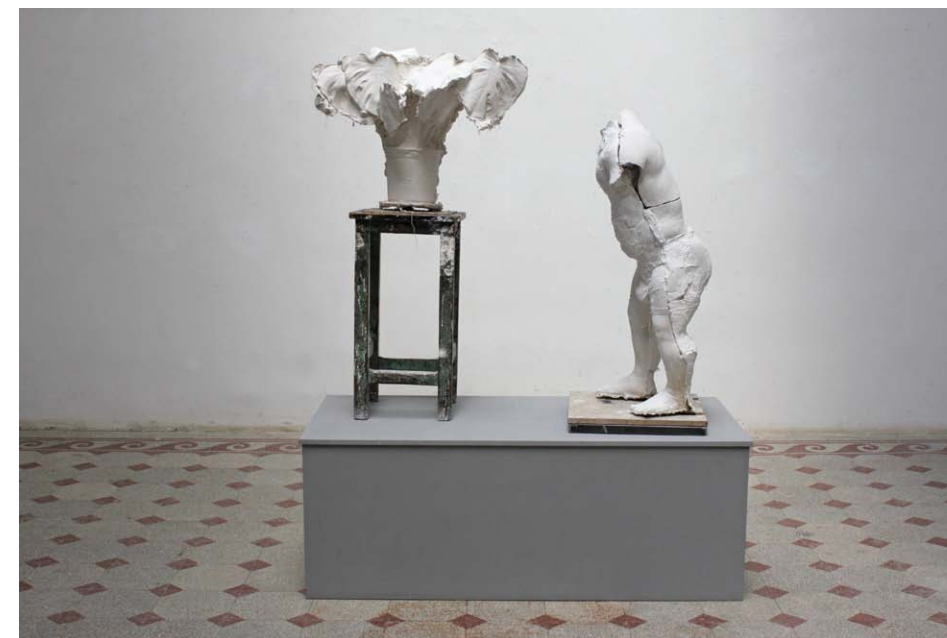
• Ámmer Gergő: Back to the Nature gipsz, szék, fa, vas 180x135x50 cm 2019-20