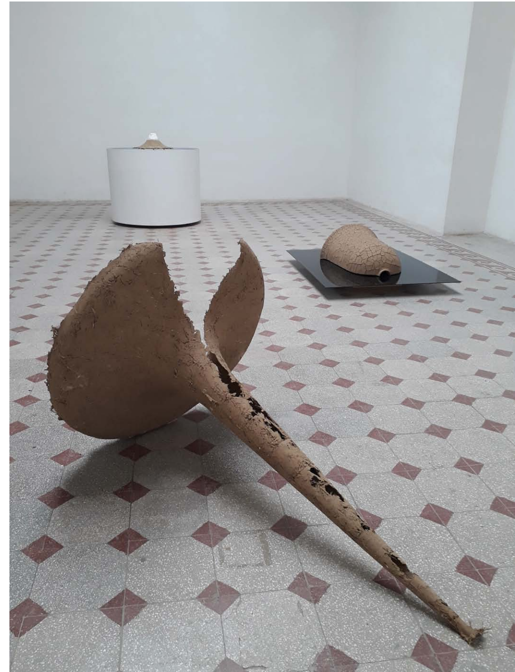
• Kiállítási enteriőr