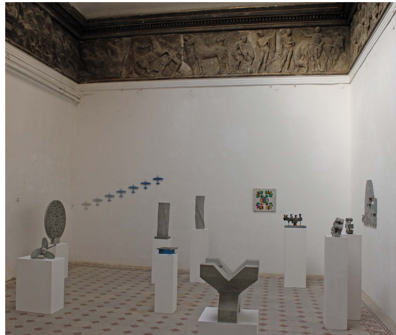
• Kiállítási enteriőr