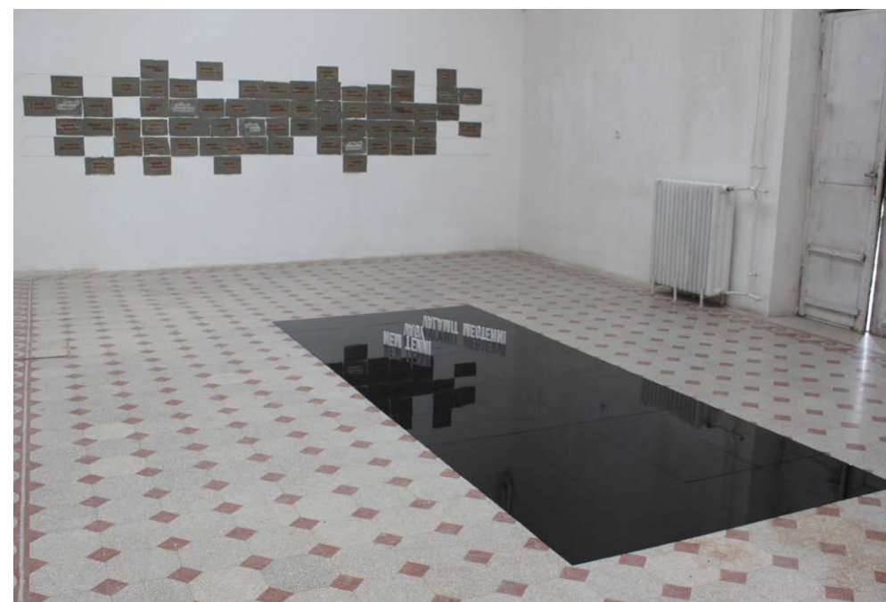
• Kiállítási enteriőr