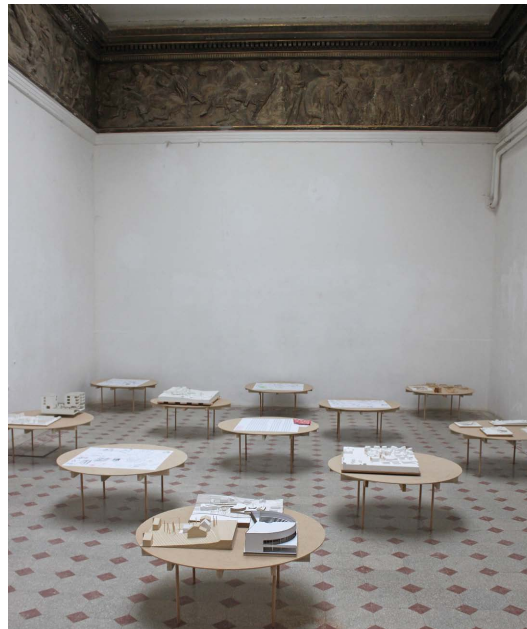
• Kiállítási enteriőr