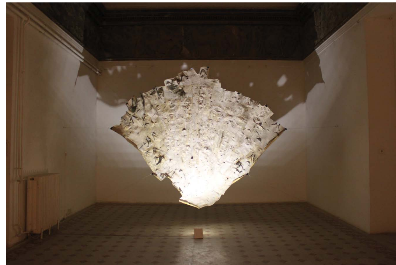
• Szunyog Júlia: Cserzett nyírfakéreg 450x400 cm 2019