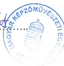
Csanádi Judit rektor

Egységes szerkezetben az 5/2016. (II. 10) szenátusi határozat szerinti módosításokkal Egységes szerkezetben a 7/2017. (II. 28.) szenátusi határozat szerinti módosításokkal