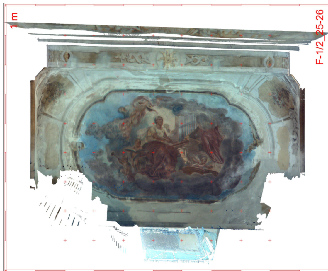
Szent Cecília mennyezetképről lézershkeneléssel készült ortofoto (2017, tisztítás előtti állapot)