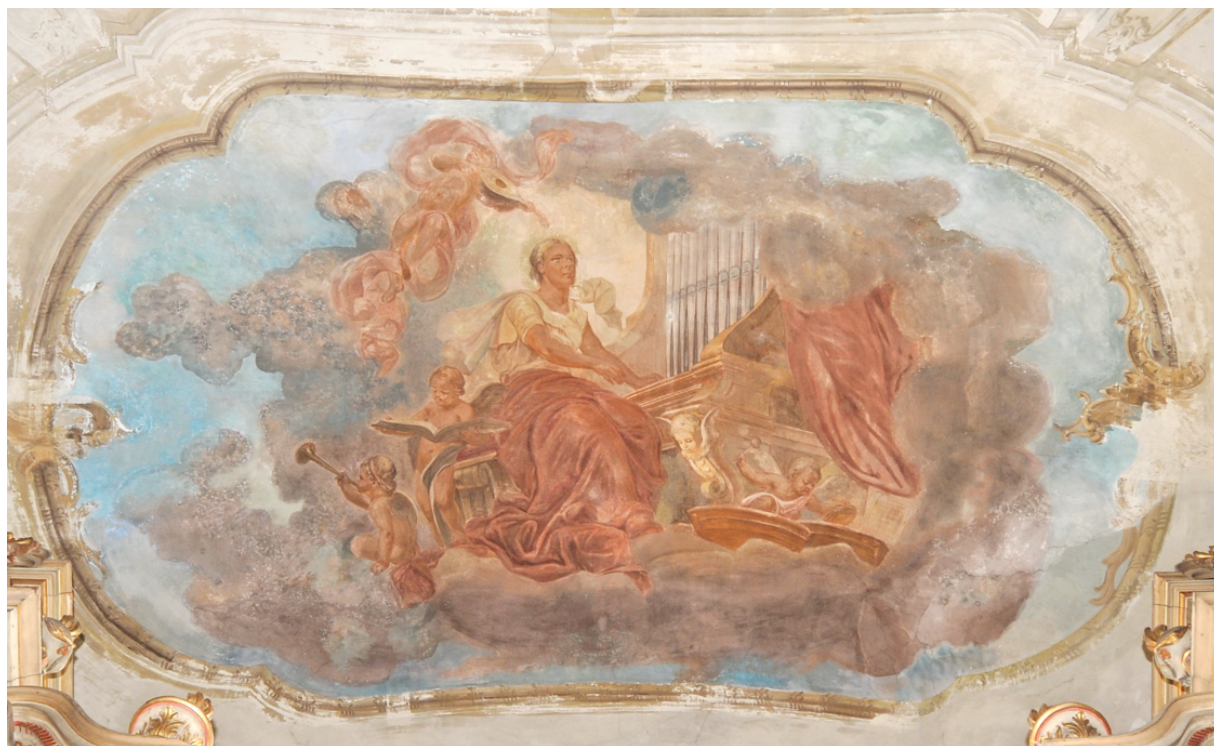
Szent Cecília mennyezetkép (2017, tisztítás előtti állapot)